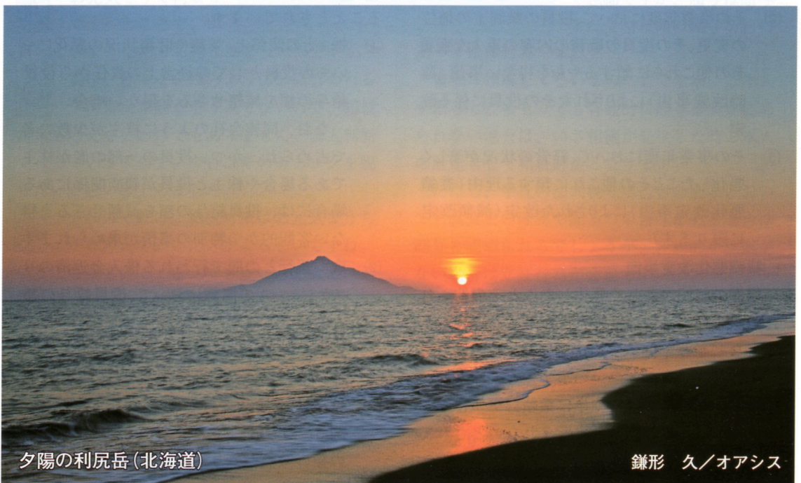
夕陽の利尻岳(北海道)