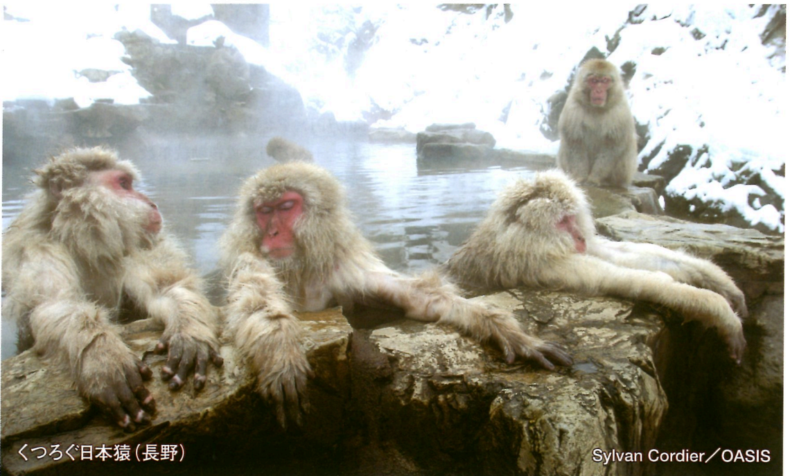
くつろぐ日本猿（長野）