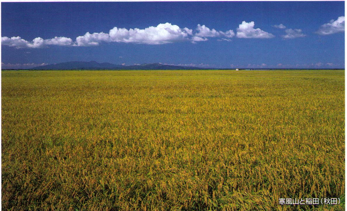
寒風山と稲田(秋田)