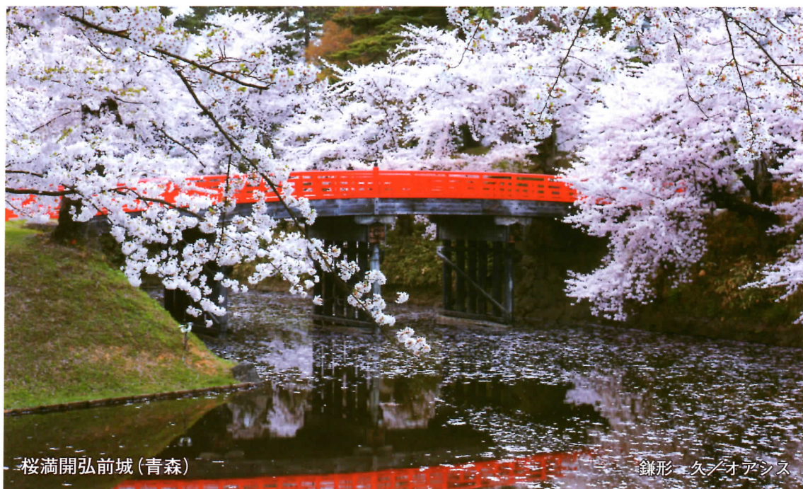
桜満開弘前城(青森)